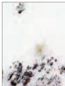
Spari antivalanga al passo

Sorvegliano linee elettriche, spengono incendi, recuperano animali e provocano anche distacchi artificiali di masse nevose. Hanno elicotteri Lama, Ecureuil e Superpuma gli specialisti della Airway di Lasa, la ditta di trasporto aereo di cui è stato chiesto l'intervento da parte della Protezione civile della Provincia.